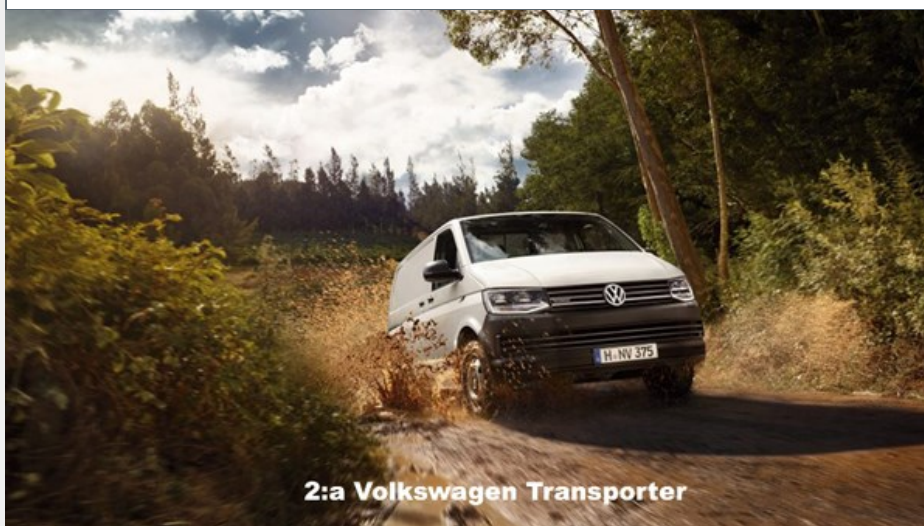
2:a Volkswagen Transporter