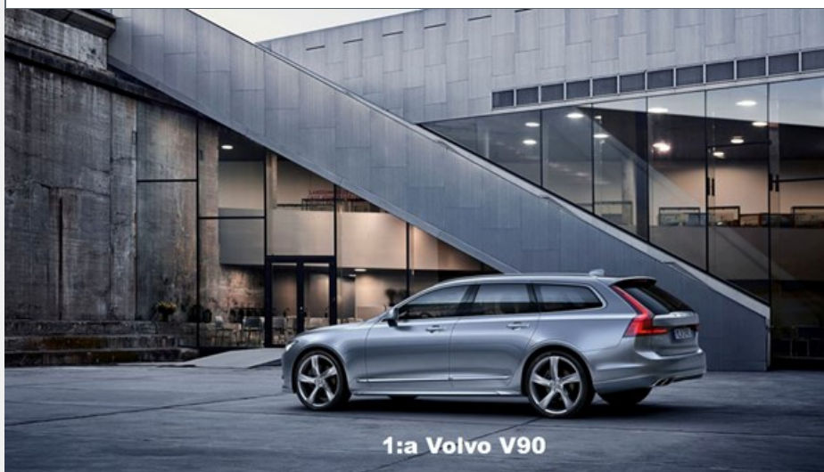
1:a Volvo V90