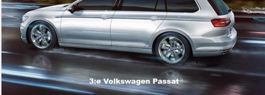
3:e Volkswagen Passat