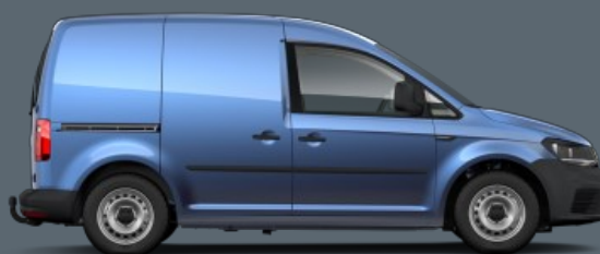
1:a Volkswagen Caddy