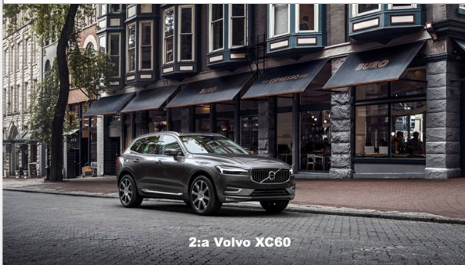
2:a Volvo XC60